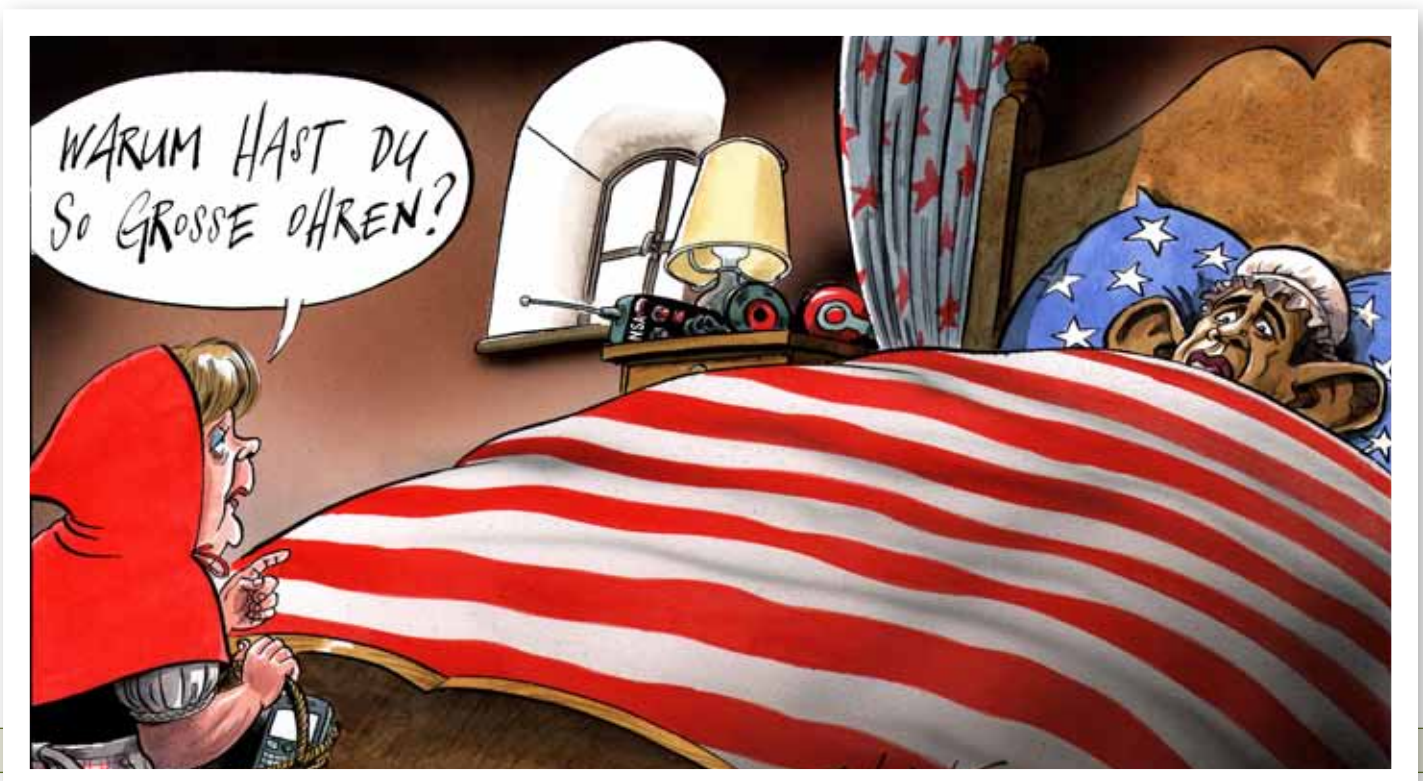
▼ Platz 3: Peter Schrank in der «Basler Zeitung» zum NSA-Skandal