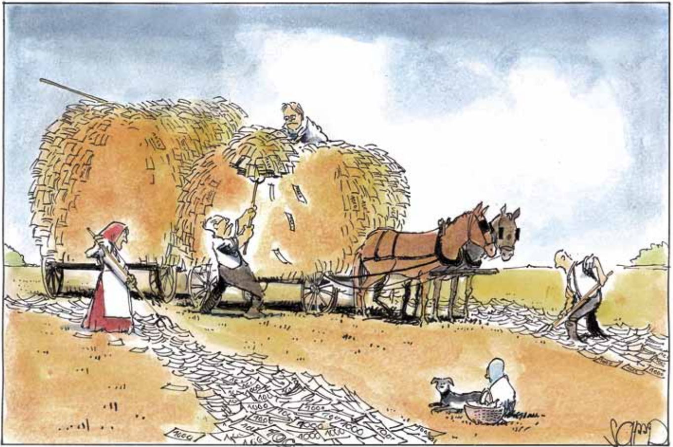
ALBERT ANKER: GELD WIE HEU (Privatbesitz)